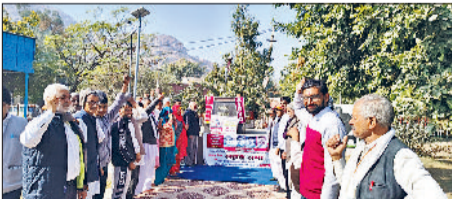
भिवानी। शहीद रामप्रसाद बिस्मिल, अशफाक उल्ला खां, राजेन्द्रनाथ लाहिड़ी व रोशन सिंह को श्रद्धांजलि देते एआईडीवाईओ व शहीद महापुरुष यादगार कमेटी के सदस्य।

भिवानी। राजकीय औद्योगिक प्रशिक्षण संस्थान भिवानी के प्रांगण में दिनांक 24 दिसंबर को प्रातः 09.00 बजे रोजगार मेले का आयोजन किया जाएगा। जिसमें इलेक्ट्रीशियन, फिटर, इलेक्ट्रॉनिक मैकेनिक, मशीनिस्ट, मैकेनिक मोटर व्हीकल, मैकेनिक ट्रेक्टर, टेक्नीशियन पावर इलेक्ट्रॉनिक सिस्टम, टर्नर, वायरमैन, फाउंड्रमैन, शीट मेटल वर्कर व्यवसायों के आईटीआई पास शुदा छात्र इस अधिक से अधिक संख्या में हिस्सा ले सकेंगे।