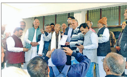
नारनौल। एसडीएम को ज्ञापन सौंपते रिटायर्ड कर्मचारी।

में कार्यरत कर्मचारियों की सुरक्षा भी प्रभावित हो रही है। यूनियन का आरोप है कि नीति लागू करने से पहले जमीनी हकीकत व कर्मचारियों की परिस्थितियों को नजरअंदाज किया