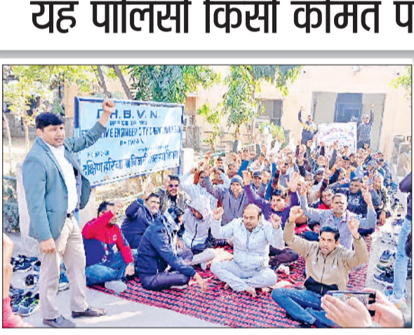
भिवानी। मांगों को लेकर नारेबाजी करते कर्मचारी तथा स्थाई डाइट बनाए जाने की मांग को लेकर मांगपत्र सौंपते हुए।