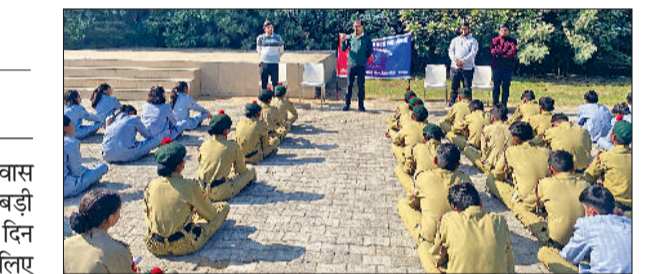
कैडेट्स ने ड्रिल, परेड एवं अनुशासन का उत्कृष्ट प्रदर्शन किया, जिसे देखकर अधिकारी ने प्रसन्नता व्यक्त की और कैडेट्स की सराहना की। विद्यालय परिसर में कविता पाठ प्रतियोगिता एवं भाषण प्रतियोगिता का भव्य आयोजन किया गया।

सरस्वती विद्या विहार आसलवास दूबिया में विजय दिवस बड़ी धूमधाम से मनाया गया। इस दिन हम आजादी और सुरक्षा के लिए अपने प्राणों को न्योछावर कर देने वाले शहीदों को याद करते हैं और नमन करते हैं। विद्यालय में एनसीसी कमांडिंग ऑफिसर के आगमन पर अनुशासन, देशभक्ति और नेतृत्व का अनुभव दृश्य देखने को मिला। कमांडिंग ऑफिसर द्वारा एनसीसी कैडेट्स का विधिवत निरीक्षण किया गया। इस दौरान