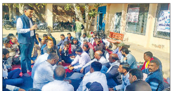
नारनौल। बैठक में कर्मचारियों को संबोधित करते यूनियन पदाधिकारी।

हरियाणा स्टेट इलेक्ट्रिसिटी बोर्ड वर्कर्स यूनियन के आह्वान पर बिजली कर्मचारियों ने अपनी लंबित मांगों को लेकर पांच दिवसीय चरणबद्ध आंदोलन की शुरुआत कर दी। आंदोलन का पहला चरण डिवीजन स्तर पर शांतिपूर्ण ढंग से आयोजित किया गया। जिसमें कर्मचारियों ने ऑनलाइन ट्रांसफर पॉलिसी का कड़ा विरोध दर्ज कराया।