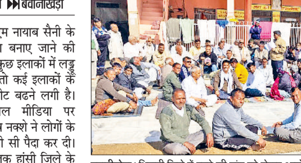
बवानीखेड़ा। भिवानी जिले में रहने की मांग को लेकर आयोजित बैठक में उपस्थित ग्रामीण।

बीते दिवस सीएम नायाब सैनी के हांसी को जिला बनाए जाने की घोषणा के बाद कुछ इलाकों में लड़ु बांटे जा रहे हैं तो कई इलाकों के लोगों की हार्टबीट बढ़ने लगी है। खासकर सोशल मीडिया पर वायरल मैसेज व नक्शों ने लोगों के अंदर एक बैचनी सी पैदा कर दी। हालांकि अभी तक हांसी जिले के साथ गांव जोड़ने की बात आई है, उसमें केवल एसपी हांसी की सीमा बंदी के हिसाब से राजस्व जिला बनाए जाने की योजना पर