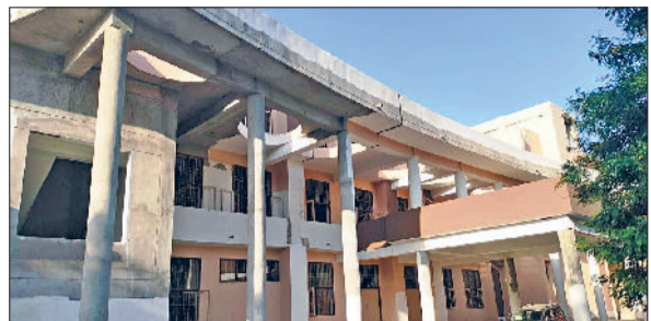
कनीना। कनीना में तैयार किए जा रहे नवनिर्मित लघु सचिवालय।

कनीना में लगभग तैयार किए जा चुके लघु सचिवालय भवन का नववर्ष में लोकार्पण किया जा सकता है। भवन में फायर सेफ्टी उपकरण सहित इंटीरियर कार्य के चलते तथा दक्षिण दिशा की ओर समुचित रास्ता न मिलने के कारण बाँते समय इसके उद्घाटन का कार्य लटक गया था। हालांकि कनीना मेहेंद्रगढ़ सड़क मार्ग के साथ साथ पंचायत समिति की