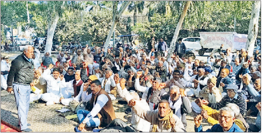
भिवानी। मांगों को लेकर आयोजित धरने को संबोधित करता एक वक्ता।