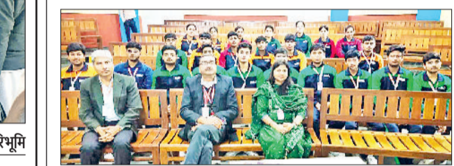
नारनौल। पारले-जी बिरिकेट फेक्ट्री का भ्रमण करते विद्यार्थी।